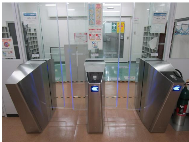
図 4. 更新した入退ゲート

入退管理システムは、SQRC を使用した認証を行っている。核融合研では個人線量計は毎月交換されるため、SQRC シールも毎月印刷・貼付けする必要がある。万が一のなりすましや複製、過去の SQRC シールの使いまわしを防ぐため、SQRC 印刷データは毎月変更している。このため、月を跨いで管理区域に入域することはできない。また、SQRC を印刷するために専用のライセンスがインストールされた PC が必要になるなど、運用面での注意点は多岐にわたる。これら SQRC データ作成と SQRC シールの印刷及び入退管理システムへのデータ登録は担当者が手作業で行ってきた。これとは別に、放射線業務従事者の管理は放射線管理室が行っている。放射線管理室では管理業務の効率化のため、放射線業務従事者登録申請シ