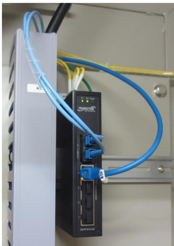
図5. 故障したメディアコンバータ