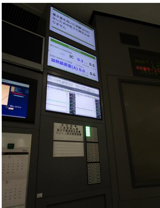
図6. 交換した大型ディスプレイと変更後の運転表示盤