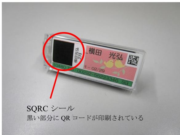
SQRC シール 黒い部分に QR コードが印刷されている