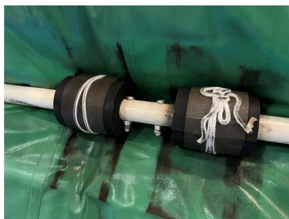
図3. 液化室ガスバッグのボルト対策