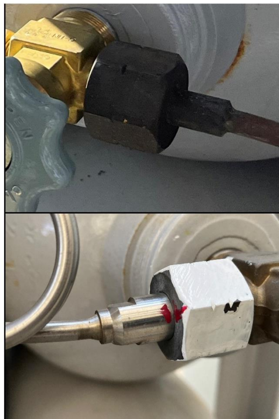
図4. 純ガスカードルのポンベ接続部分。(上) 変更前のスリーブ押えのないもの。円筒状で切欠がないため、配管側をレンチでつかむことができない。(下) 変更後のスリーブ押えの有るもの。切欠があるため、配管側をレンチでつかむことができる。

え付きのものに変更して頂いた（図4）。ヘリウム漏洩の原因としては、トラック運搬中の振動や、純ガスカードル設置場所への着地時の衝撃によって接続箇所が緩むことが考えられる。この対策として、純ガス