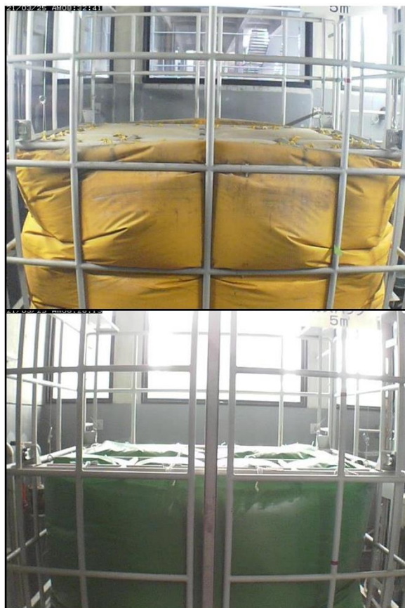
図2. (上) 交換前の容積5.2 m 3 のガスバッグ。ガスバッグと外枠が擦れ合っていた。(下) 交換後の容積4.1 m 3 のガスバッグ。ガスバッグと外枠の接触が低減された。