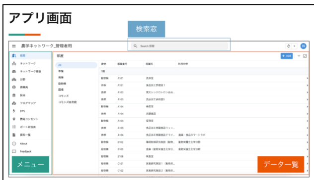
図2 ネットワーク管理アプリケーション

部屋情報から開通ネットワークの、機器情報一覧、該当ネットワーク担当の連絡先などの表示が可能である。本アプリケーションにより、「ファイルを開く」→「検索情報の突合」→「別ファイルも調べる」という作業が、ブラウザから起動し、調査情報を検索欄に入力するだけで取得できるようになった。