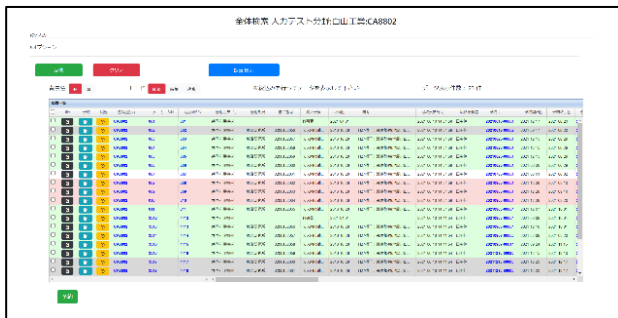
図2 機材を一覧表示できる全体検索画面

機材管理システムは、予約/使用履歴情報から、現在の各機材が使用中か保管中かを判定して表示したり、予約開始日・終了日などの節目に管理者に通知したりできるよう設計した。予約・在庫状況をガントチャートで確認できる画面も用意した(図3)。エクセルファイルのエクスポート/インポートを可能とした。最新の機材情報の保存や、既存の管理簿の引き継ぎ、エクセルで編集した情報の一括更新ができる。