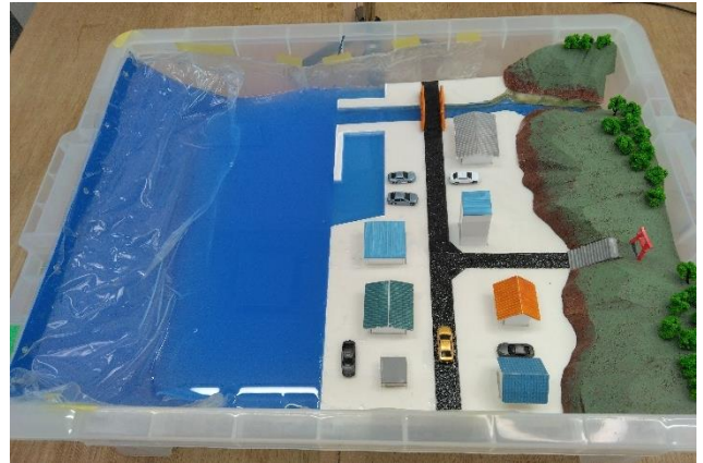
図 1 触察用可動港湾模型

本体はバックルコンテナに収められており、外寸 450(W)×259(D)×159(H) (mm)となっている。