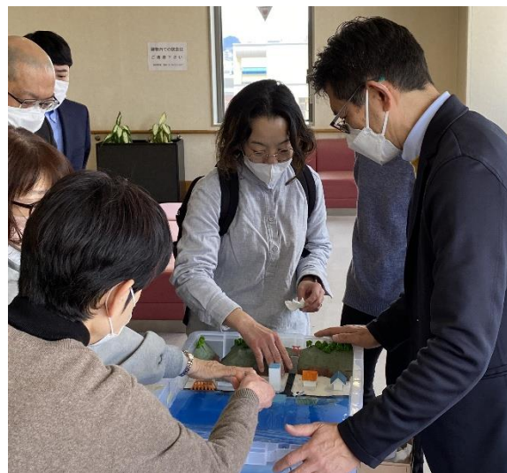
図 4 機器展示の様子