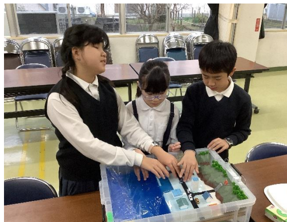
図 5 熊本盲学校での使用テスト