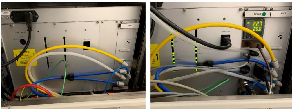
図 1 BSMS/2 ユニット後部の換装前後

分光計の BSMS/2 ユニットの電源を切り、筐体に固定するためのネジを外した。分光計のバックパネルを外し、BSMS/2 ユニットのスライドさせ、分光計内での作業スペースを確保した (図 1 左)。BSMS/2 の後ろ側にある PNK3 の左のメクラ板を外し、BVT3200 を取り付けた。また、BSMS/2 の電源ユニットのメクラ板を外し、外部電源ユニットを取り付けた。メクラ板を取り付け、既存の BVT3000 に接続されているエア配管やケーブル類を、BVT3200 に接続した。分光計の電源ケーブルを、外部電源ユニットに接続した。BSMS/2 ユニットの再度筐体に固定し、バックパネルを取り付けた後、BSMS/2 ユニットの電源を入れ、BVT3200 の Eurotherm 2416 に温度が表示されることを確認した (図 1 右)。最後に、TopSpin 3.7p10 の温度コントロール画面より、冷却ユニット (BCU05) と併せて動作確認、温度校正を行った。