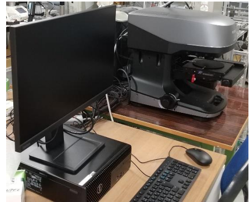
図 1 VK-X3000 レーザー顕微鏡

レーザー顕微鏡は大気中で試料に前処理を施さなくても高分解能な画像が得られる。真空中で非金属試料に対しては前処理が必要な SEM と比較すると取扱が圧倒的に簡便である。また、3次元形状の取得もできるため、表面粗さなどの測定も可能である。これまで著者はセラミックス試料の表面観察でしかレーザー顕微鏡を利用したことがなかったが、昨年度より共焦点レーザー顕微鏡である KEYENCE 社製 VK-X3000 (図 1) を利用しやすい環境ができ、「比較計測」という機能を使う機会があったため、そのときの内容を元に新たに試料を用意し、計測を行った。このほかレーザー顕微鏡にかかわるいくつかの事例について当日報告する予定である。