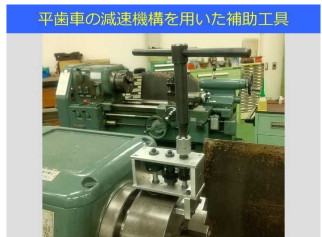
図2. 試作した力不足を補助する工具

また、力不足を補助する工具の試作も行ったが、力を軽減する為にギヤ比を大きくし過ぎると、作業性が悪くなることが明らかになった。(図2)