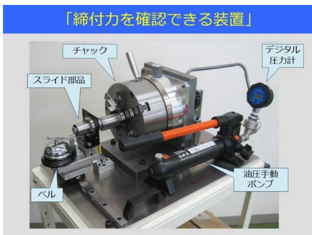
図3. 締付力を確認できる装置の概要

この装置を開発することにより、普段の締付力を簡易的に確認する他、「力不足」を補助する工具の評価と効果を簡易的に検証することが可能になる。(図3)