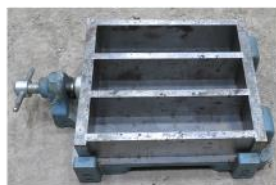
写真 3 セメント強さ試験 供試体用型枠