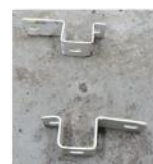
写真 7 蓋固定用アングル