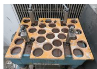
写真 4 位置固定用の合板