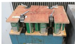
写真 6 合板の蓋