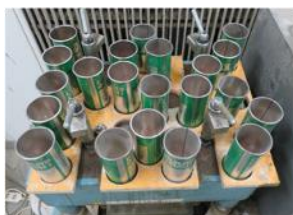
写真 5 円筒型枠を設置した様子