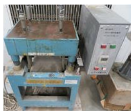
写真 2 テーブルバイブレータ