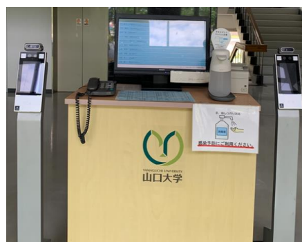
写真 居所案内 PC(2024年7月撮影)